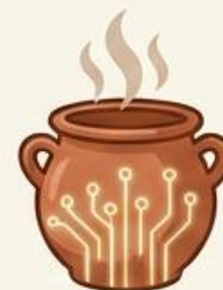
LOGO ICONA (MINIMAL)

Uso: Comunicazione istituzionale, frontale del dispenser.