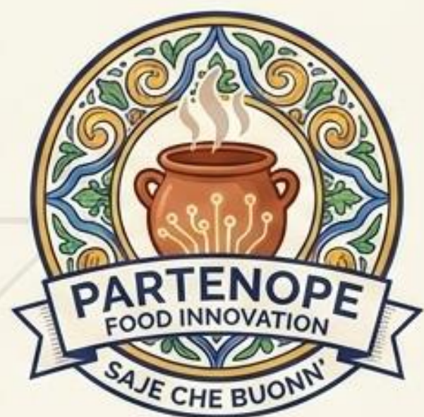
VARIANTE PIGNATA SMART (CON PAY-OFF)

Uso: Appuntamento digitale, icona App Partenope Connect.