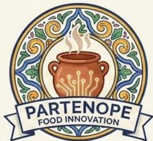
LOGO PRINCIPALE (FULL COLOR)

Uso: Comunicazione istituzionale, frontale del dispenser.