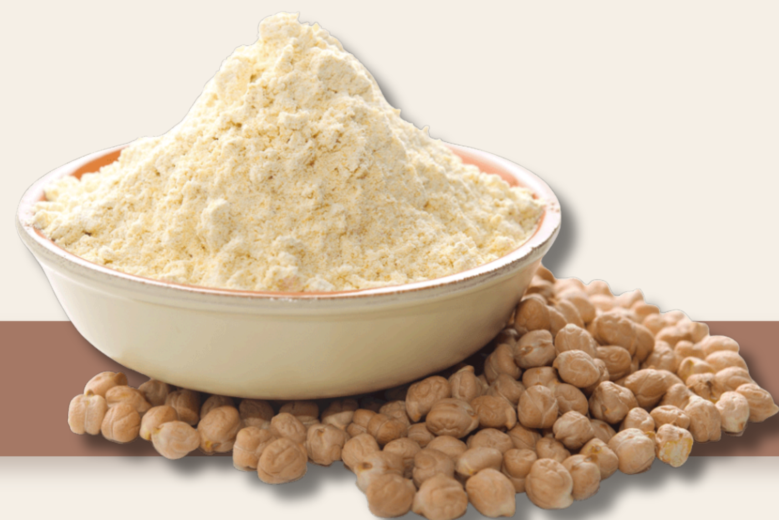
Farina di ceci