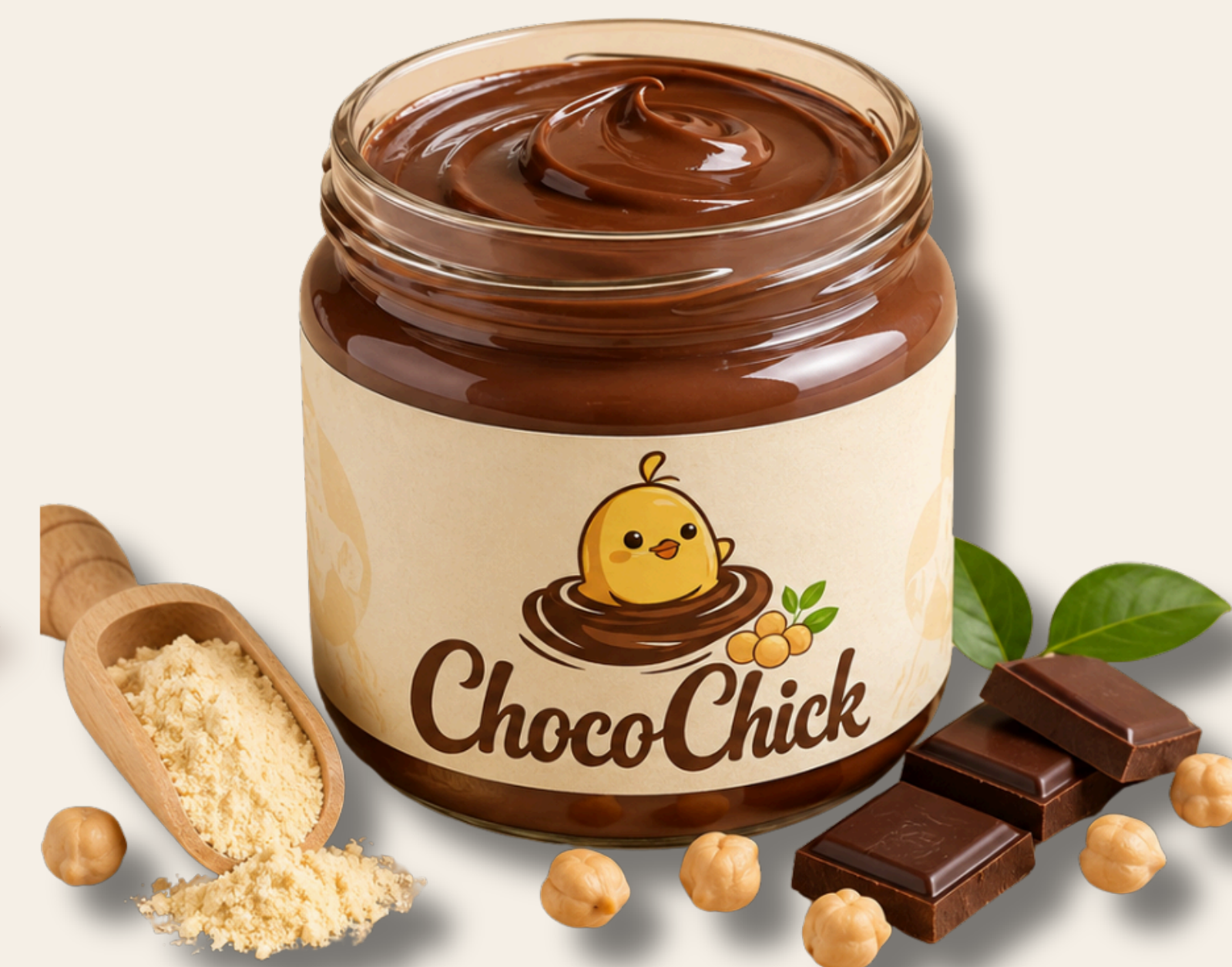
Crema spalmabile (e nuovo valore)

Riduciamo lo spreco valorizzando ciò che esiste già.