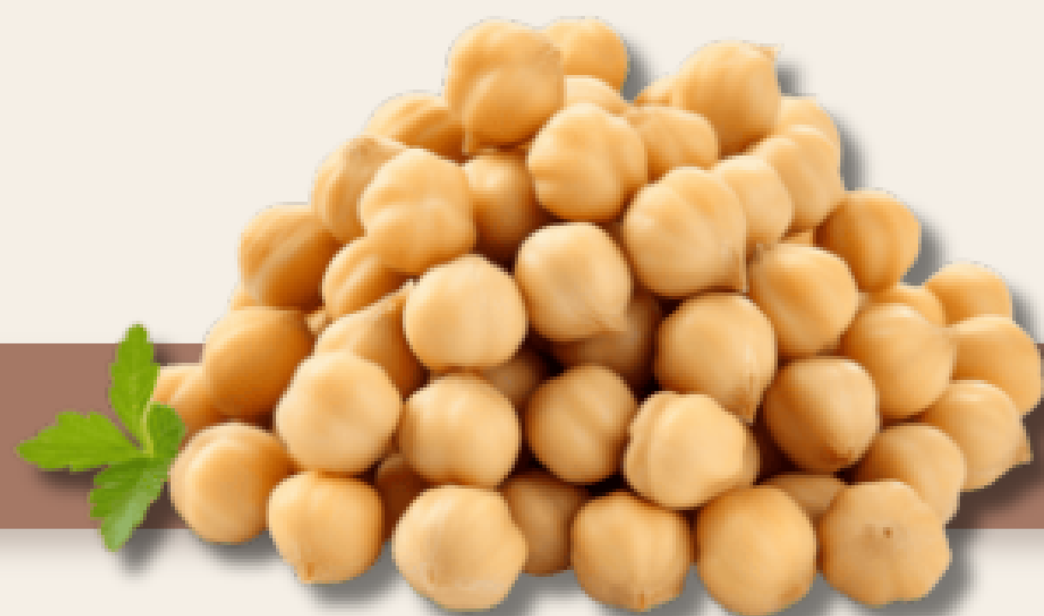
Ceci di seconda scelta